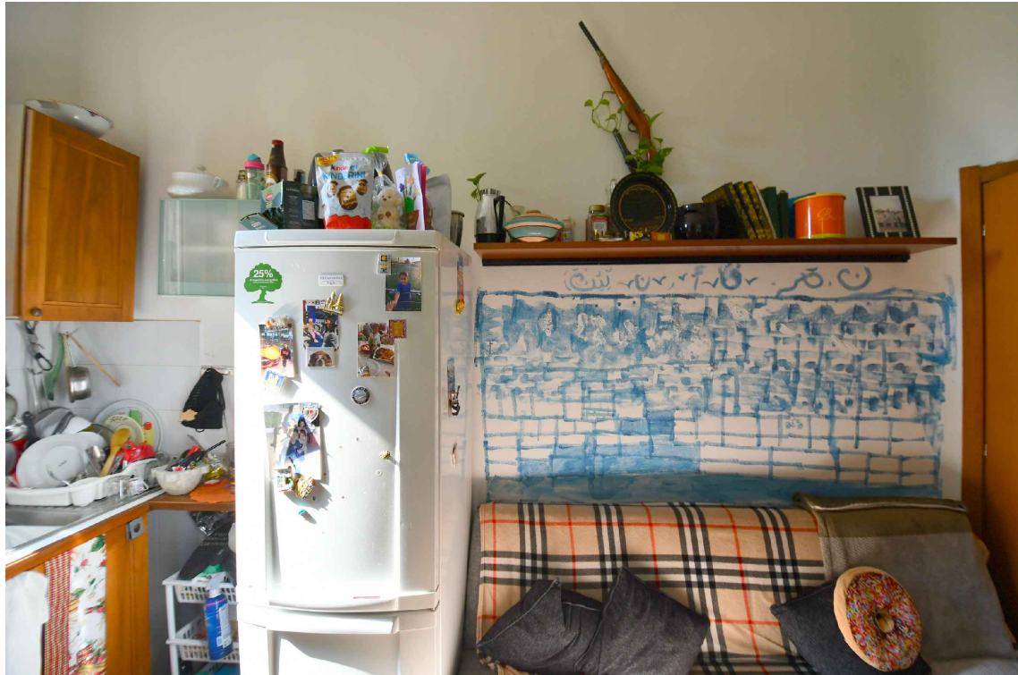
5.01| Interno 5 - Soggiorno e cucina