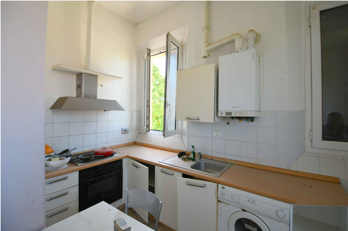
3.01| Interno 3 - Soggiorno e cucina