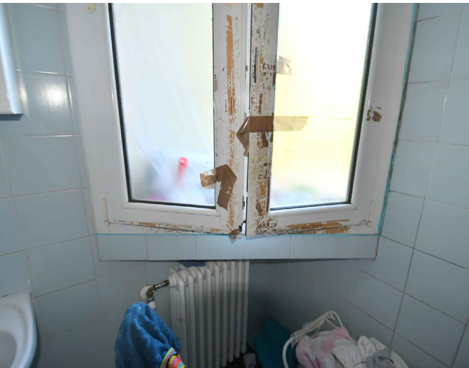
5.03| Interno 5 - Bagno - Dettaglio finestra da sostituire