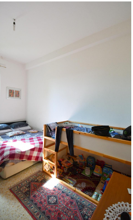
5.02| Interno 5 - Camera doppia